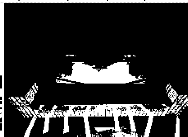
Una visione dello stadio in ambientazione notturna