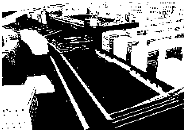
Il nuovo Luigi Ferraris secondo la Fondazione Genoa